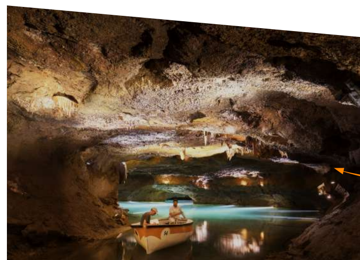
Coves de Sant Josep

L'element més destacat d'un conjunt hidràulic que transportava l'aigua des de la Font de Sant Josep al poble és l'Aqüeducte de Sant Josep. La seua construcció apunta a un origen romà, encara que els tres arcs centrals són clarament medievals, segurament fruit d'una reconstrucció del segle XIV. A més a més, també es pot observar l'Aqüeducte de l'Alcúdia format per un arc de mig punt i dos molins de farina, tot d'origen medieval. Al costat, la Fàbrica de la Llum (20), instal·lació industrial de principis del segle XX i futura seu del Museu Arqueològic.