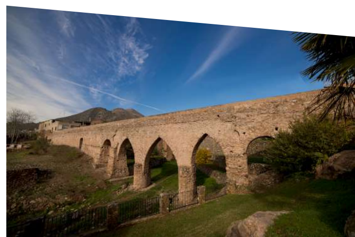
Aqüeducte de Sant Josep

Restes arqueològiques d'un assentament localitzat sobre el tossal que alberga Les Coves de Sant Josep. Un enclavament visitable replet d'història declarat Bé d'Interès Cultural, on s'han documentat diverses fases d'ocupació que es desenvolupen durant el període ibèric (entre els segles VI i II a. C.) i l'època tardo-romana (entre els segles IV i V d. C.).