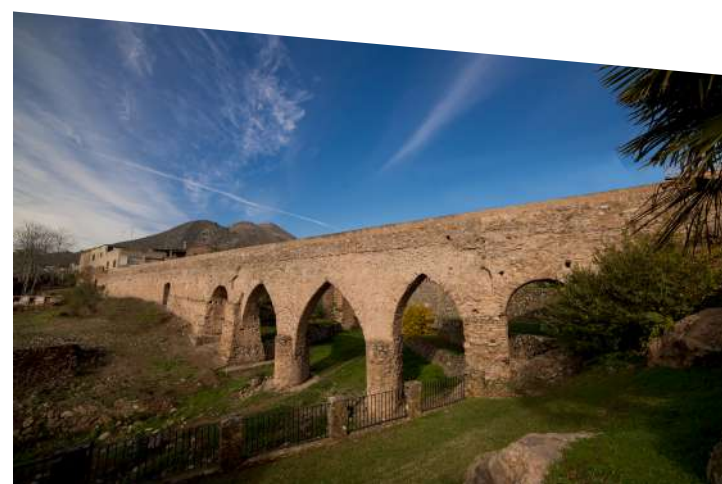
Acueducto de San José

Restos arqueológicos de un asentamiento localizado sobre la colina que alberga Coves de Sant Josep. Un enclave visitable repleto de historia declarado Bien de Interés Cultural, donde se ha documentado varias fases de ocupación que se desarrollan durante el período ibérico (entre los siglos VI y II a. C.) y la época tardorromana (entre los siglos IV y V d. C.).