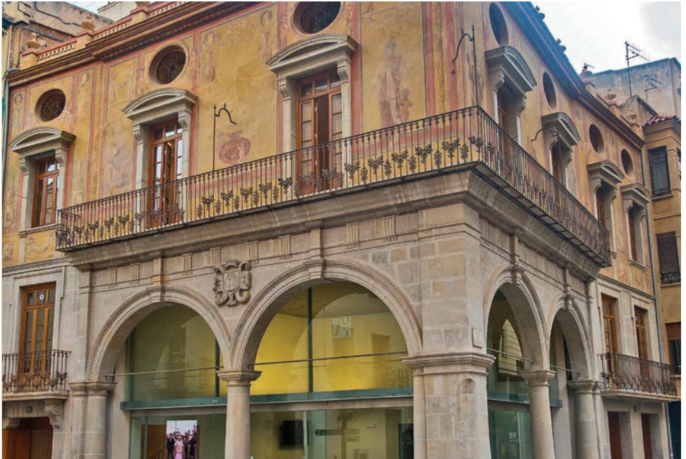
Lonja del Cànamo