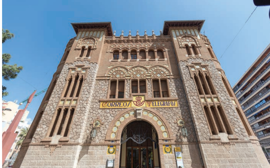
Correos y Telégrafos