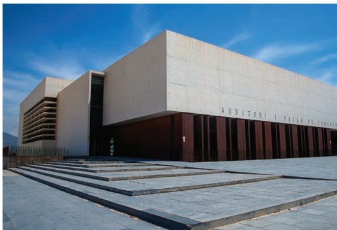
Auditorio y Palacio de Congresos

Su estética recuerda a la de muchos otros edificios de la misma época, contruidos con fines similares en distintas partes del país durante los años 30 del siglo XX. No obstante, sus creadores, Joaquín Dicenta Vilaplana y Demetrio Ribes Marco, quisieron dotarlo de un carácter único, incorporando elementos constructivos autóctonos como el ladrillo, el vidrio y la cerámica, en un homenaje a la rica tradición arquitectónica. Este emblemático edificio se encuentra en un punto estratégico de la ciudad, entre la Avenida de Jaume I y la Plaza de Tetuán, invitando a ser descubierto.