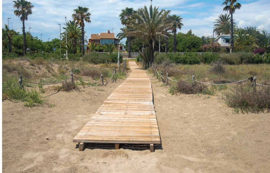
Playa del Gurugú